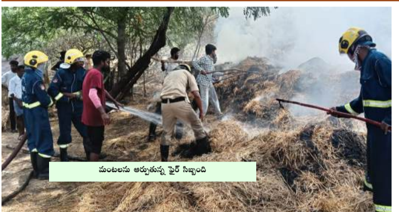
మంటలను ఆర్డుతున్న ఫైర్ సిబ్బంది