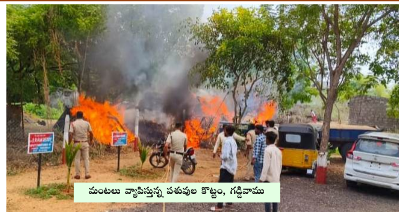
మంటలు వ్యాపిస్తున్న పశువుల కొట్లం, గడ్డివాము