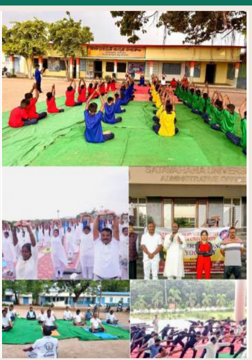
సూర్యనమస్కారాలు శరీర దృఢత్వానికి, ఆరోగ్యానికి