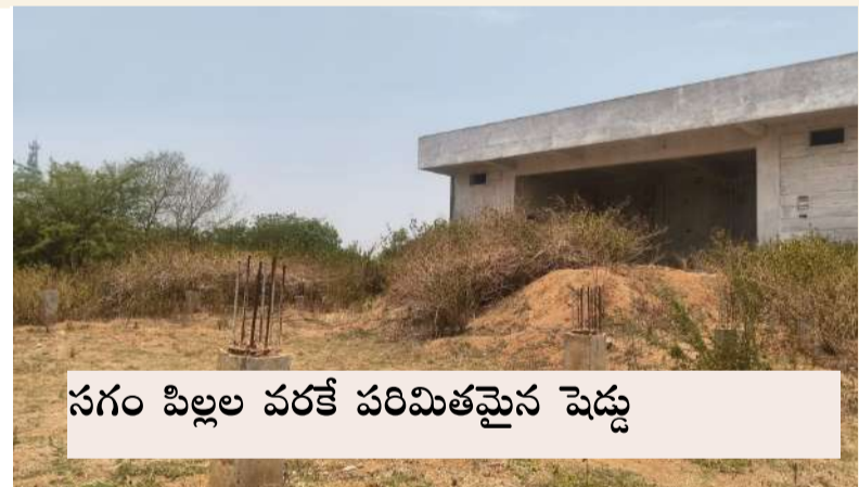
సగం పిల్లల వరకే పరిమితమైన షెడ్యూ

నిరుపయోగంగా జనరల్ కమ్యూనిటీ హాల్. కేసీఆర్ ప్రభుత్వం ఈ హాల్ను నిర్మించింది. ఈ కమ్యూనిటీ హాల్ అందుబాటులోకి వస్తే పేద, ఎస్సీ, ఎస్టీ, బీసీ కుటుంబాలకు ఎంతో మేలు జరుగుతుందని స్థానికులు భావిస్తున్నారు. ప్రైవేట్ ఫంక్షన్ హాల్ అడ్డం తీసుకోలేని పరిస్థితుల్లో అప్పులపాలు కాకుండా, తక్కువ ధరలకు ఈ హాల్ వినియోగం సాధ్యమవుతుందని ప్రజలు ఆశిస్తున్నారు. అయితే ఇప్పటికీ మౌలిక సదుపాయాలు -- మంచినీరు, విద్యుత్, పనీ గృహాలు -- ఏర్పాటు చేయకపోవడంతో భవనం నిరుపయోగంగా మారింది. 2024 ఆర్థిక సంవత్సరంలో కమ్యూనిటీ హాల్ ముందు భాగంలో ఓపెన్ షెడ్ నిర్మాణానికి 25 లక్షల డిఎంఎఫ్ డి నిధులు మంజూరు చేసి పిల్లల్ని నిర్మించారు. కానీ నిధులు నిలిపివేయడంతో పనులు ఆగిపోయాయి. గ్రామీణ ప్రాంత ప్రజలు మాట్లాడుతూ, "వివాహాలు, శుభకార్యాలను గౌరవంగా జరుపుకునేందుకు ఈ కమ్యూనిటీ హాల్ తక్షణమే అందుబాటులోకి రావాలి. ప్రభుత్వం వెంటనే స్పందించి మౌలిక సదుపాయాలు పూర్తి చేయాలి" అని విజ్ఞప్తి చేశారు.