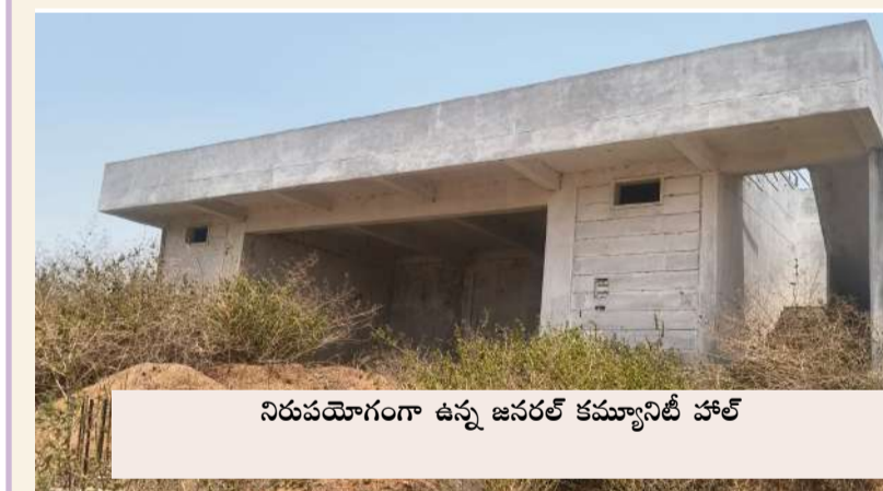
నిరుపయోగంగా ఉన్న జనరల్ కమ్యూనిటీ హాల్