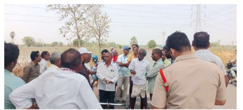
భూ సర్వే పై రైతులతో మాట్లాడుతున్న తహసీల్దార్

ఎలిగేడు, జూన్ 15 (నీలగిరి ఎక్స్ ప్రెస్):