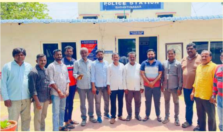
పాలకుర్తి, జూన్ 13 (సీలగిరి ఎక్స్ ప్రెస్)