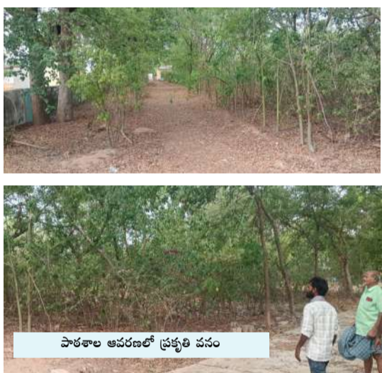
పాఠశాల ఆవరణలో ప్రకృతి వనం